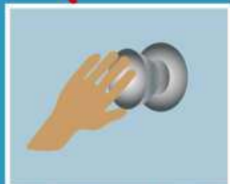
КОНТАКТ С ЗАГРЯЗНЕННЫМИ ПОВЕРХНОСТЯМИ