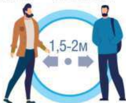
СОБЛЮДАЙТЕ РАССТОЯНИЕ И ЭТИКЕТ