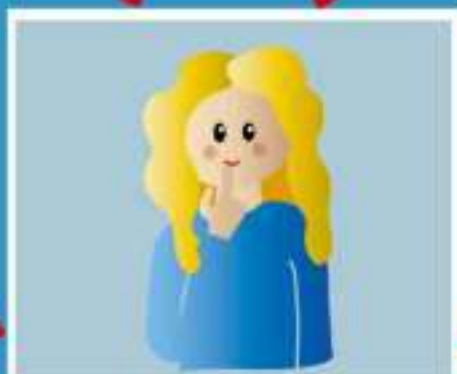
ПРИКОСНОВЕНИЕ К ЛИЦУ, ГЛАЗАМ, НОСУ, РТУ