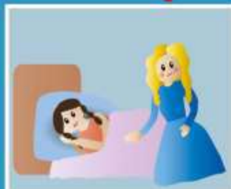
УХОД ЗА БОЛЬНЫМИ