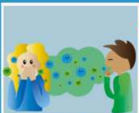
КАШЕЛЬ, ЧИХАНИЕ (ВОЗДУШНО-КАПЕЛЬНЫМ ПУТЕМ)